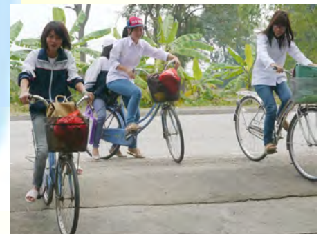
Das Waisen- und Behindertenheim in Soc Trang braucht noch viel Unterstützung.