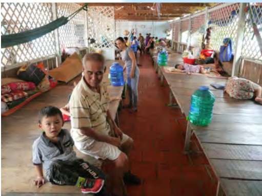
Behandlung und 'Betten-Saal' für Patienten im Zentrum für traditionelle Medizin in Cho Moi